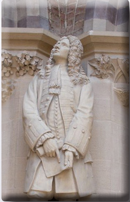
G.W. Leibniz (1646-1716)